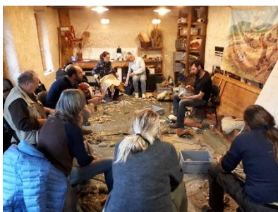
Formation taille de silex à Saint-Just pour les membres du RSPB

En 2019, le temps bénévole consacré à la préparation, l'animation et le suivi des activités proposées par le pôle patrimoine s'élève à 144 jours.