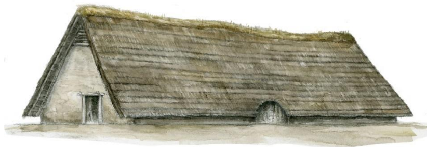
Dessin Pierrick Legobien

Le plateau numérique de chantier mégalithique sera finalement remplacé par une carte interactive des mégalithes bretons. Nous avons également recueilli 72 % des financements prévus pour le projet. Un travail sur les contenus (hors numériques) a également été mené avec des étudiants du Master Médiation du patrimoine et de l'histoire d'Europe à Rennes. Ils ont réalisé un quizz de 40 questions façon « incollables » pour une version du sac, un questionnaire de satisfaction qui servira lors de la phase test du sac, réalisation d'un prototype de jeu « time line », rédaction de textes pour le carnet « mode d'emploi » du sac'h, test d'activités avec le fac-similé parure néolithique.