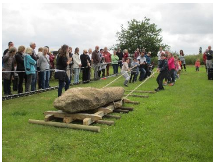
Jna à Colpo