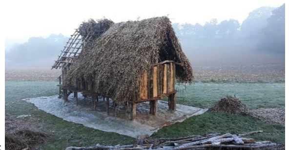
Chantier de la maison néolithique à Renac